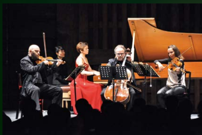
赤穂城跡特設会場