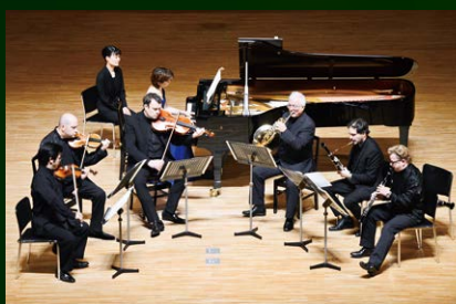
パルナソスホール