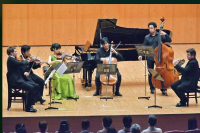
ハーモニーホール