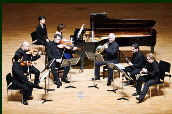
パルナソスホール