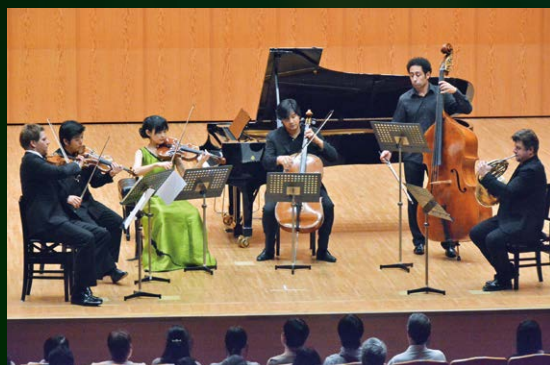
ハーモニーホール