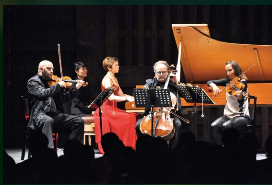
赤穂城跡特設会場